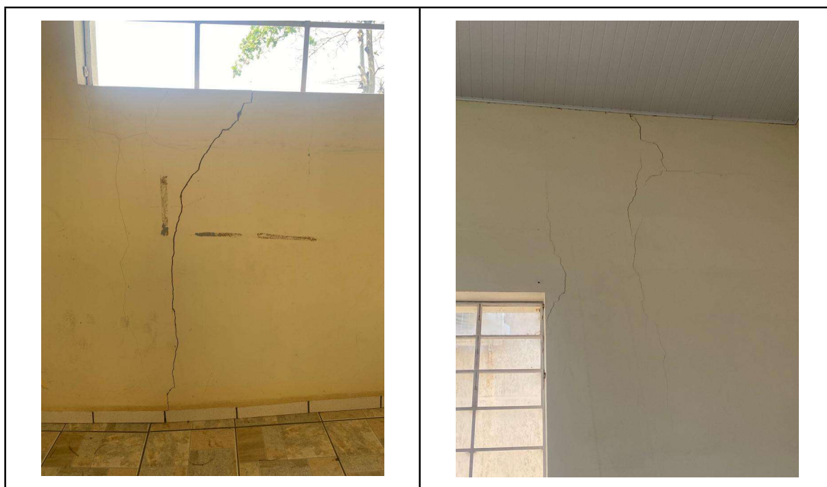
Figura 02- Fissuras

Deverão ser realizados reparos nas fissuras encontradas nas paredes laterais do auditório. Realizar a remoção do reboco em faixas de aproximadamente 60cm no contorno da trinca. Colocar grampos em ferro CA-60 Ø5,0mm, com espaçamento entre grampos de 15cm. Após o grampeamento da trinca, sobre os grampos, chapiscar e rebocar (com inclusão de tela de aço galvanizada/zincada) toda a área. Após a cura do reboco, realizar aplicação e lixamento de massa látex em toda a área reparada.