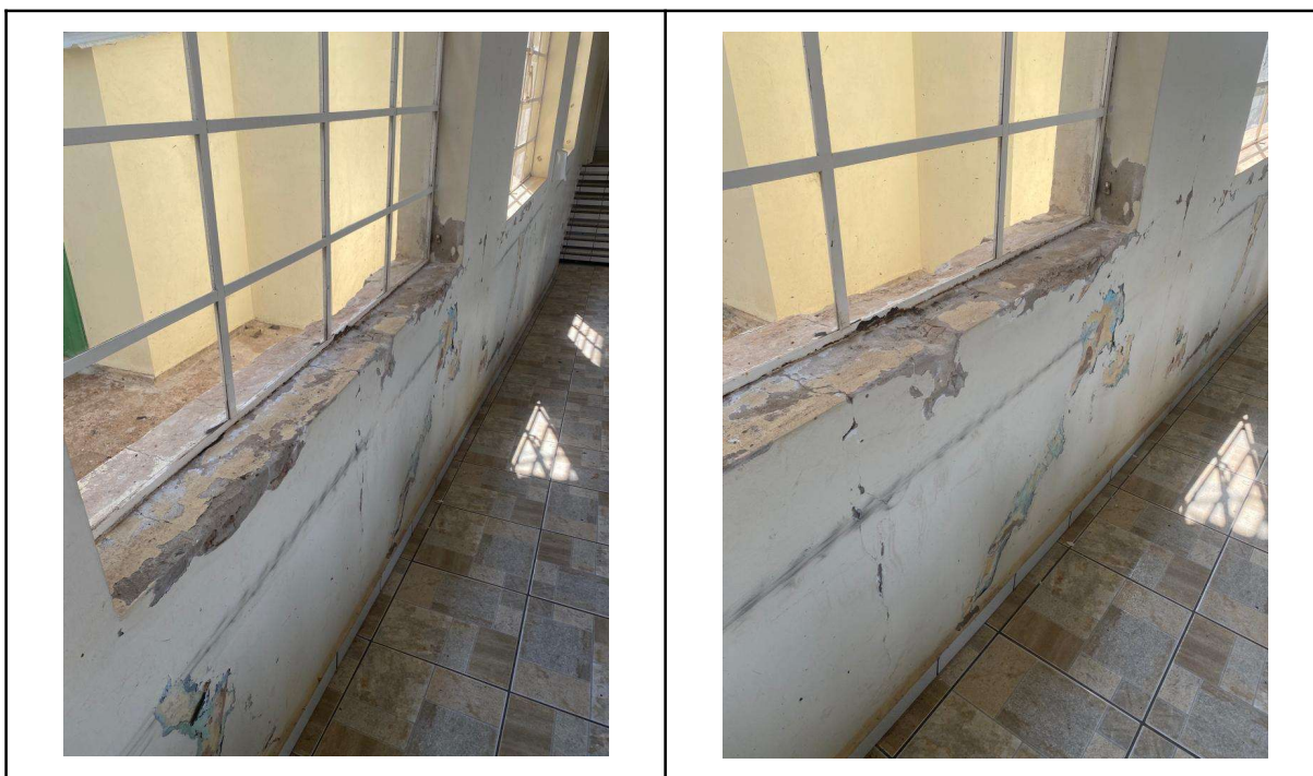
Figura 01- Exemplo de peitoril a ser reparado

Nas janelas deverá ser realizada a vedação de todo seu perímetro (10m) com selante elástico à base de poliuretano (PU), visando estanqueidade destas. Nas regiões dos peitoris danificadas pela infiltração, realizar a demolição do reboco existente, executar novo chapisco (traço 1:3), aplicação de massa única (traço 1:2:8) e aplicação e lixamento de massa látex, deixando a parede pronta para posterior recebimento de pintura.